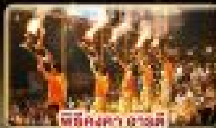
พิธีบูชา