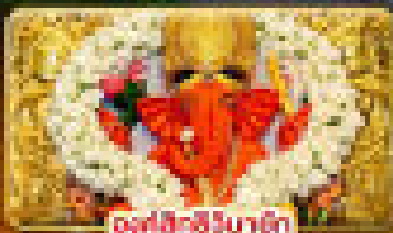
องค์สีชมพู

เปิดรับความสำเร็จ.. สักการะ พระพิฆเนศ 10 องค์