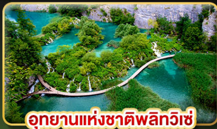
อุทยานแห่งชาติพลิตวิซ