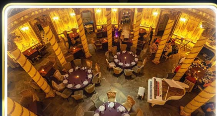
ทานอาหารสุดหรู ร้าน Turandot