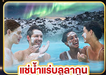
แช่น้ำแร่ลูลาทูน