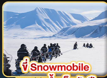
ขี่ Snowmobile บนธารน้ำแข็งพันปี