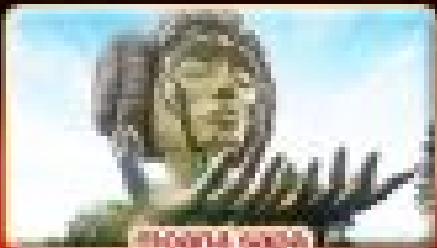
ชมชนเผ่าฮม้ง