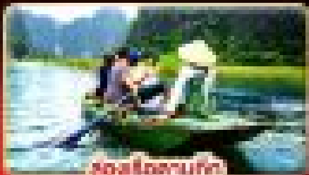
ล่องแก่งสนุก