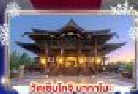
วัดเซ็นโซจิ เกียวโต

ชมความประทับใจ "HAKUBA IWATAKE MOUNTAIN RESORT"