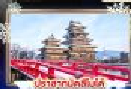
ปราสาทนาคสึโนะ