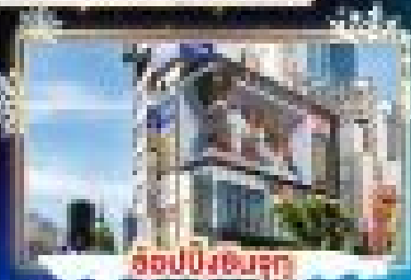
ฮอนปังชินจูกุ