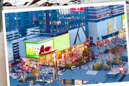
ถนนไท่กู๋หลี่หลิน