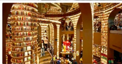
ร้านหมิงฮ้อจชุก่อ