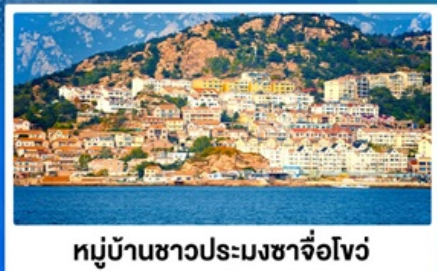
หมู่บ้านชาวประมงซาจ้อโจว