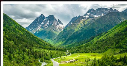
สี่ดรุณี