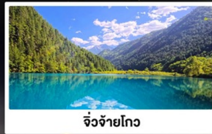
จิ้งจ้ายโกว