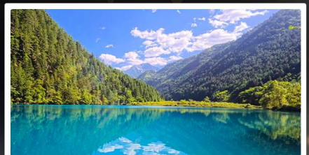
จิ่งจ้ายโกว