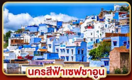
นครสีฟ้าเชฟชาอูน

📅 เดินทาง: 18-27 ต.ค. | 02-11 ธ.ค. 69 27 ธ.ค. 69 - 05 ม.ค. 70