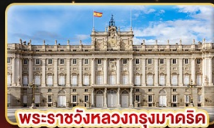
พระราชวังหลวงกรุงมาดริด