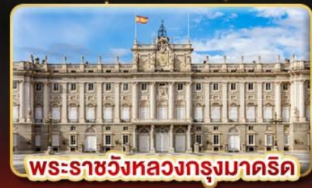
พระราชวังหลวงกรุงมาดริด