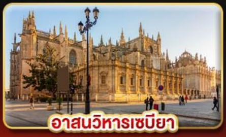
อาสนวิหารเซบิยา