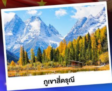
กู๋เหาสีครุณี

ชมบรรยากาศใบไม้เปลี่ยนสี "สถานที่ท่องเที่ยว 5A อุทยานจิวจ้ายโกว"