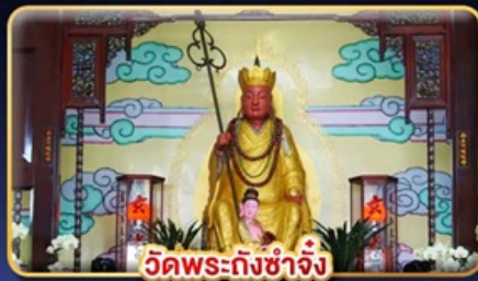
วัดพระถึงช้าง