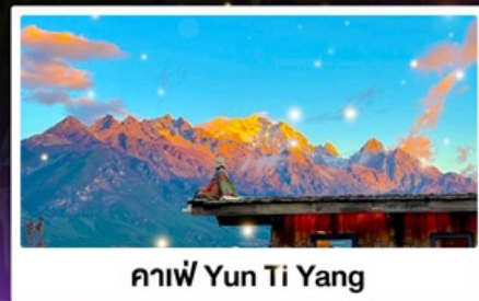
กาแฟ Yun Ti Yang