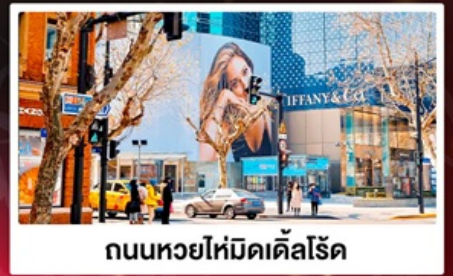
ถนนหวยไห่มีดัดส์โรด