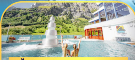
แช่น้ำแร่ร้อนผ่อนคลายลวยคอร์ส