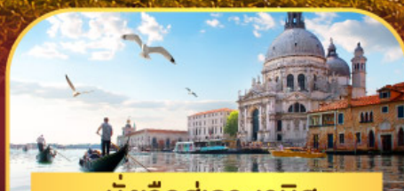
นั่งเรือสุกาะเวนิส