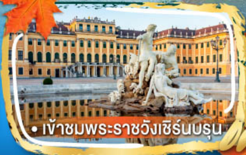
• เข้าชมพระราชวังซีร์นบรุน