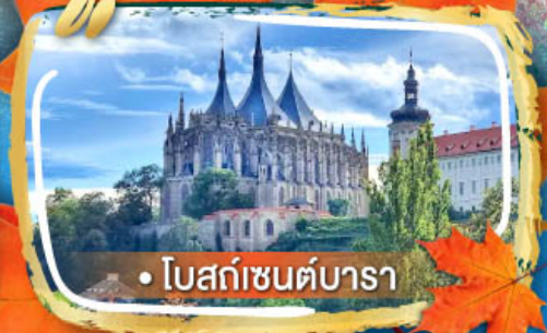
• โบสถ์เซนต์บารา

06-13, 09-16 ต.ค. / 29 พ.ย. - 06 ธ.ค. 69