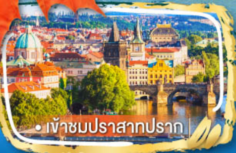
• เข้าชมปราสาทปราก