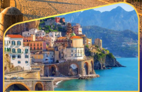
ชมวิวมอลฟีโคสก์