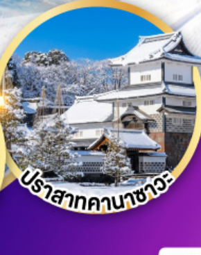
ปราสาทคานาซาว่า