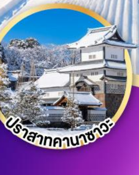
ปราสาทคานางาวะ