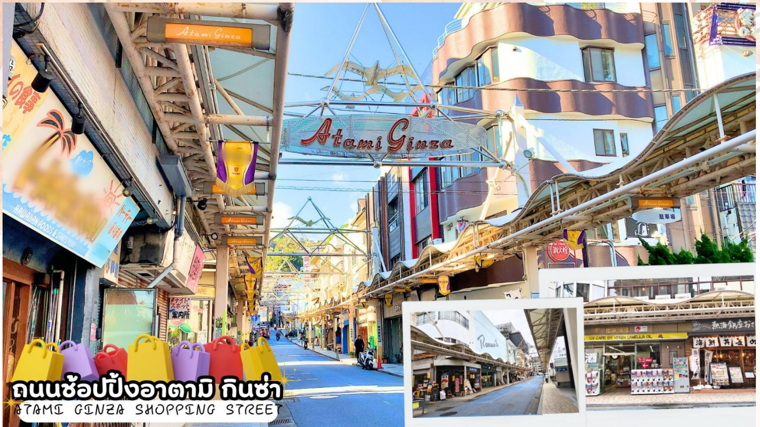
ถนนช้อปปิ้งอาตามิ กินซ่า ATAMI GINZA SHOPPING STREET

ถนนช้อปปิ้งอาตามิ กินซ่า (Atami Ginza Shopping Street) ตั้งอยู่บนถนนกินซ่า ศูนย์กลางของบ่อน้ำพุร้อนอาตามิในสมัยเอโดะ และชายฝั่งทะเล แหล่งช้อปปิ้งหลักสำหรับนักท่องเที่ยวและคนท้องถิ่น อาคารสไตล์ย้อนยุคหลายแห่งยังคงหลงเหลืออยู่ให้ความรู้สึกคิดถึงวันวาน ที่โดดเด่นด้วยบรรยากาศย้อนยุคสมัยโชวะ ผสมผสานกับร้านค้าสมัยใหม่ มีคาเฟ่ที่น่ารักๆ ภายในร้านจะตกแต่งที่นั่งเป็นแบบห้องออนเซ็น และยังมีจะมีพุดดิ้ง ซอฟครีมรวมไปถึงกาแฟ ให้ท่านได้ลิ้มลอง และยังมีร้านเครฟชาเขียวที่ขึ้นชื่ออีกด้วย รวมไปถึงร้านอาหารทะเลราคาย่อมเยาว์