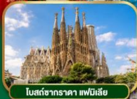
โบสถ์ซากราดา แฟมิลี