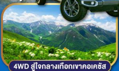
4WD สู๊ใจกลางเทือกเขาคอเคซัส