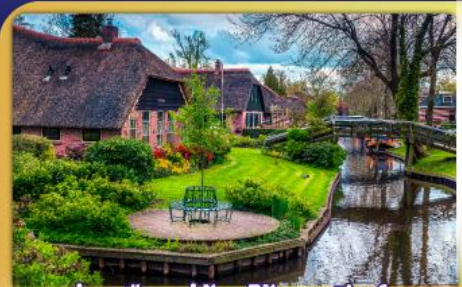
ล่องเรือหมู่บ้านไรทนนท์รูร์น