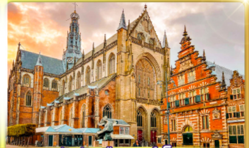
จัตุรัสเมืองฮาร์ลิม

พรมแดนเมืองเนเธอร์แลนด์และเบลเยียม เคนเมืองเคลฟท์ เมืองเครื่องปั้นดินเผาระดับโลก ฮาร์ลิมเมืองมั่งคั่งที่สุดของเนเธอร์แลนด์