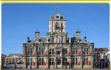
อาคารเมืองเก่าคลองเมืองเคลฟท์