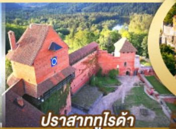
ปราสาทกูโรต้า