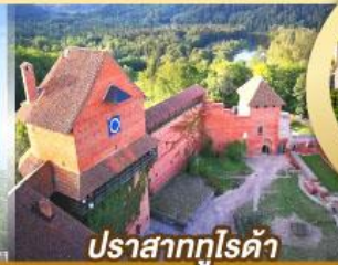
ปราสาทกูไรต้า