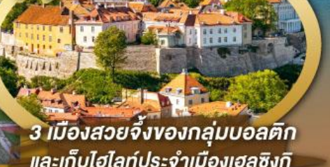
3 เมืองสวยจิ้งของกลุ่มบอลติก และเก็บไฮไลท์ประจำเมืองเอสซิงกี และล่องเรือเฟอร์รี่ข้ามประเทศ

ไฮไลท์ในโปรแกรม • เที่ยวสามประเทศหลักกลุ่มบอลติก • ชมเมืองหลวงวิลนิอุส ประเทศลิทัวเนีย