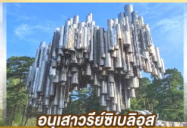
อนุสาวรีย์ซีเบลึอุส