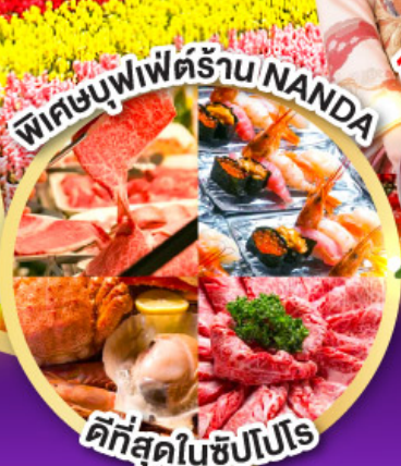
พิศมบุฟเฟต์ร้าน NANDA