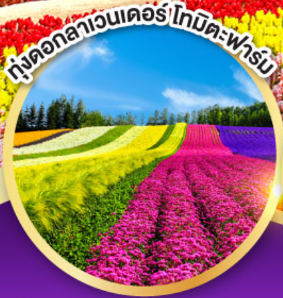
ทุ่งดอกลาเวนเดอร์โทมิตะฟาร์ม