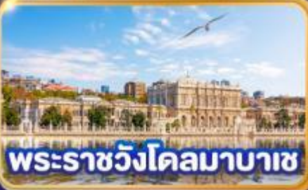
พระราชวังโคลมาบาซ