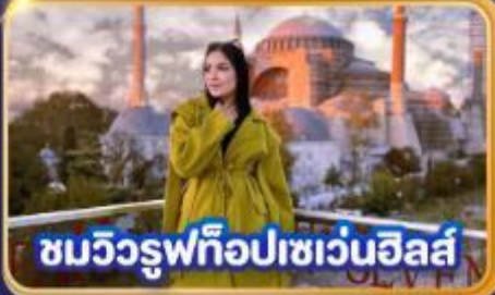
ชมวิวยูฟิโอปเซเวนฮิลล์