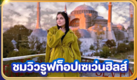
ชมวิวยูฟือปเซเวนฮิลส์