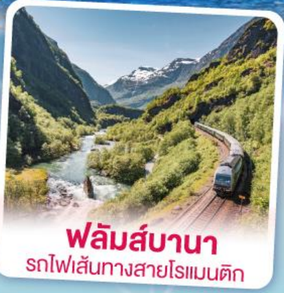
พหลิมส์บานา รถไฟเส้นทางสายโรแมนติก