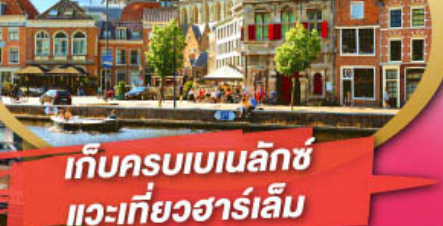
เก็บครบเบเนลักซ์ แวะเที่ยวฮาร์เล็ม