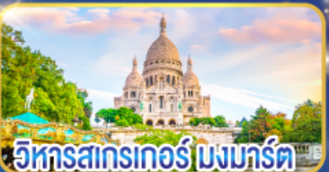
วิหารสกรเกอร์ มงมาร์ต