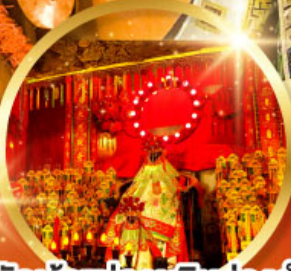
วัดเจ้าแม่กวนอิมอ่องอำ (สวนหนานเท่เลียน)