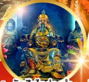
วัดปักโต้อ่องอำ