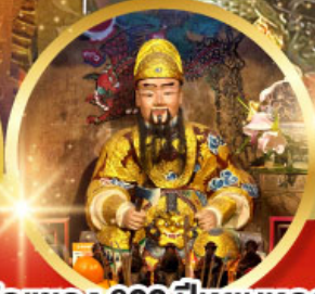
วัดแซกง 600 ปีหยุนหลอง