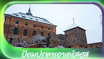
ป้อมปราการอาร์คติก