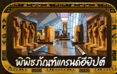
พีพีธร์กัณฑ์แกรนด์อียิปต์