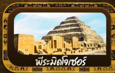
พีระมิดโจเซอร์