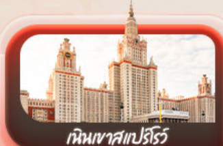
เนินเขาสเปร์ไร