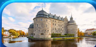
ปราสาทไอเรโบ