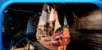
พิพิธภัณฑ์ทัวชา

Scandinavian Lover Capital Sweden Norway Denmark