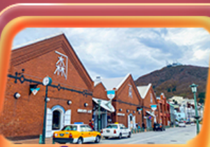
โค้งอิฐแดง