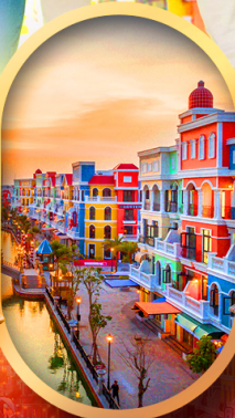
เอนิเมะแห่งเวียดนาม