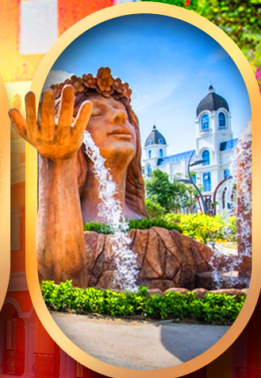
น้ำตกเทพพิหตุยง