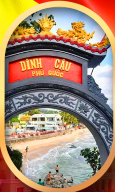
ศาลเจ้าติงเกา