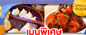
เมนูพิเศษ เสี่ยวหลงเปา หมูน้ำแดง เดินทาง ต.ค. 69 - มี.ค. 70