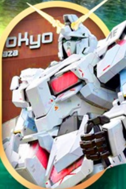
ห้างไอโดะกันดั้ม