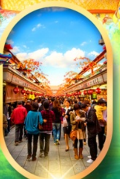
ถนนนากามิสะ