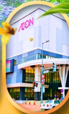
อ็อนมอลล์