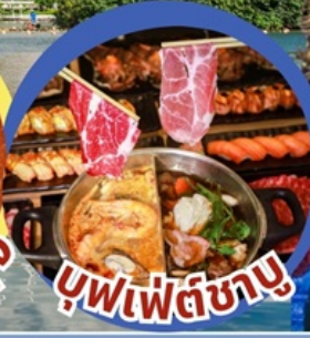
บุฟเฟต์ชาบู