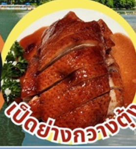
เป็ดย่างกวางตุ้ง