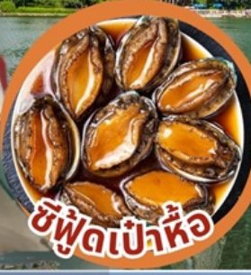
ซีฟู้ดเป่าหื้อ