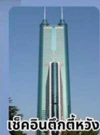
เข็คฉินตึกตีห้วง