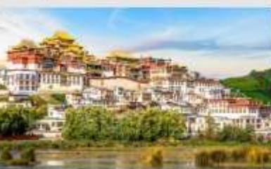
วัดลามะชงจันหลิน