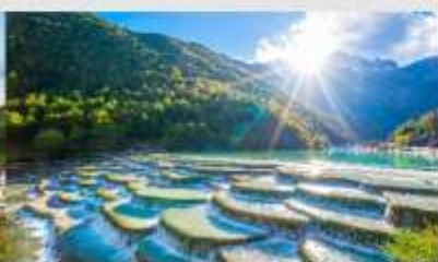
ทะเลสาบไป๋สุ่ยเหอ