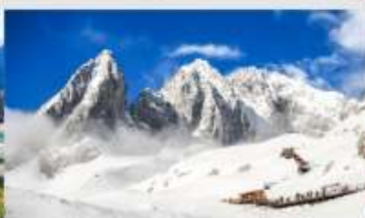
ภูเขาหิมะมังกรหยก