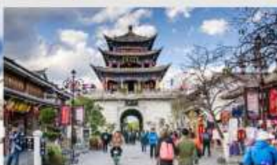
เมืองโบราณต้าหลี่

*ทางบริษัทฯ ขอสงวนสิทธิ์ในการสลับโปรแกรมทัวร์ตามความเหมาะสมขึ้นอยู่กับสถานการณ์ปัจจุบัน โดยคำนึงถึงผลประโยชน์ของลูกค้าเป็นสำคัญ