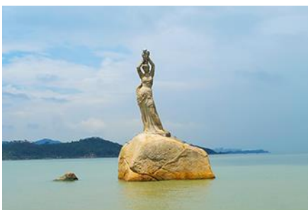
จูไห่ฟิชชอร์รี่ริล

พักที่ IRVINE HOLIDAY HTL OR HUICHANG HTL 3* หรือโรงแรมในระดับเดียวกันในเมืองจูไห่