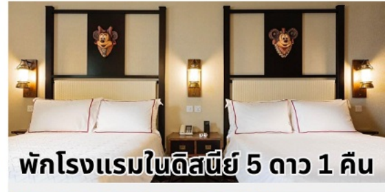
พักโรงแรมในดิสนีย์ 5 ดาว 1 คืน