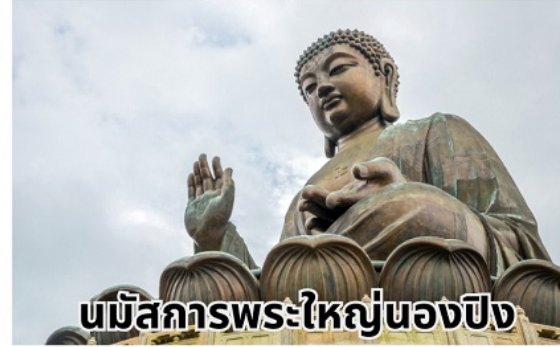
นมัสการพระใหญ่นองปิง