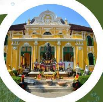
สวนสมุนไพร อภัยภูเบศร