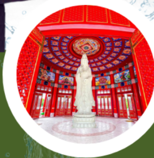
อู่ทองเกียรติ

แก่งหินเพิง KEANG HIN POENG อุทยานแห่งชาติเขาใหญ่