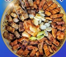
อาหารพรีเมียม ไม่จางร้านทั่ว