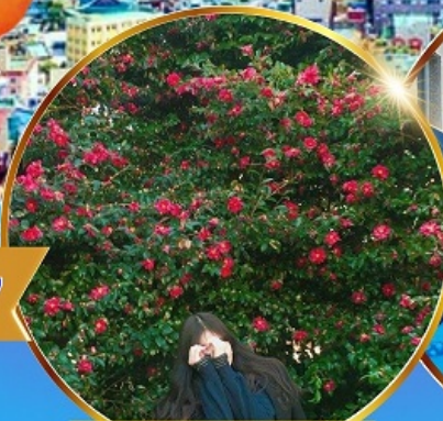
ชมดอกคามิเลีย