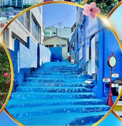
หมู่บ้านริมหทะเล