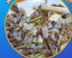
ซันนิกจิ อาหารท้องถิ่น