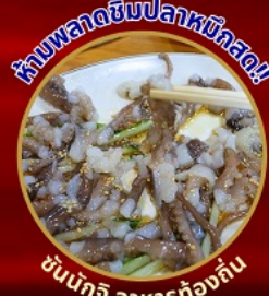
ห้ามพลาดชิมปลาหมึกสด!

โปฮังสเปซวอล์ก สกายวอร์ค ตามรอยซีรีส์ Hometown chachacha ถ่ายรูปชิคๆ หมู่บ้านวัฒนธรรมคิมซอน ขึ้นเคเบิลคาร์ ชมทะเลปูซาน นั่งรถไฟปู๊กบีก sky capsule ชิมของอร่อยตลาดแฮนแด อิสระช้อปปิ้ง Lotte Duty Free