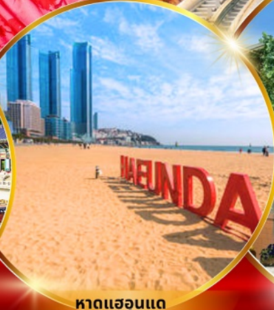
หาดแฮนแด