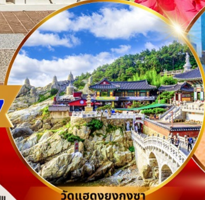
วัดแสงยงกุงซา