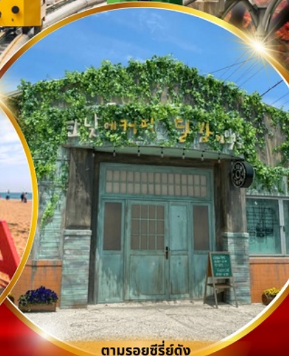
ตามรอยซีรีส์ดัง Hometown chachacha

โปฮังสเปซวอล์ก สกายวอร์ค ตามรอยซีรีส์ Hometown chachacha ถ่ายรูปชิคๆ หมู่บ้านวัฒนธรรมคิมซอน ขึ้นเคเบิลคาร์ ชมทะเลปูซาน นั่งรถไฟปู๊กบีก sky capsule ชิมของอร่อยตลาดแฮนแด อิสระช้อปปิ้ง Lotte Duty Free