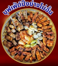
บุฟเฟ่ต์ปิ้งย่างไม่อั้น