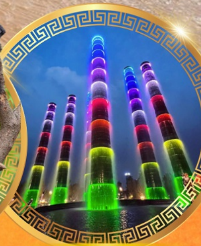
ชมการแสดงแสงสี