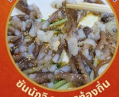
ชิมเนื้อ อาหารท้องถิ่น