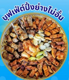
บุฟเฟ่ต์ปิ้งย่างไม่อื่น